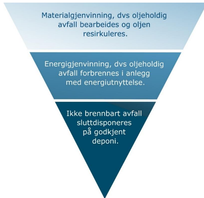
Figur 1. Avfallshirarki i en oljevernaksjon