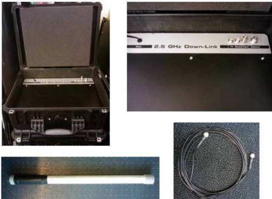
Fig. 2 Portabel mikrobølgemottaker

Portabelt system består av en koffert med en mottaker og en pc, samt en antenne.