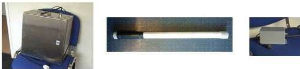
Fig. 1 Fastmontert mikrobølgemottaker

Disse består av en antenne som er montert fast ute, en forsterkerboks som står i forbindelse med antennen, et rustfritt skap som er mottakeren og som gjør om mikrobølgesignalet til kompositt signal. Disse systemene er fast montert, og koblet til en fast pc.